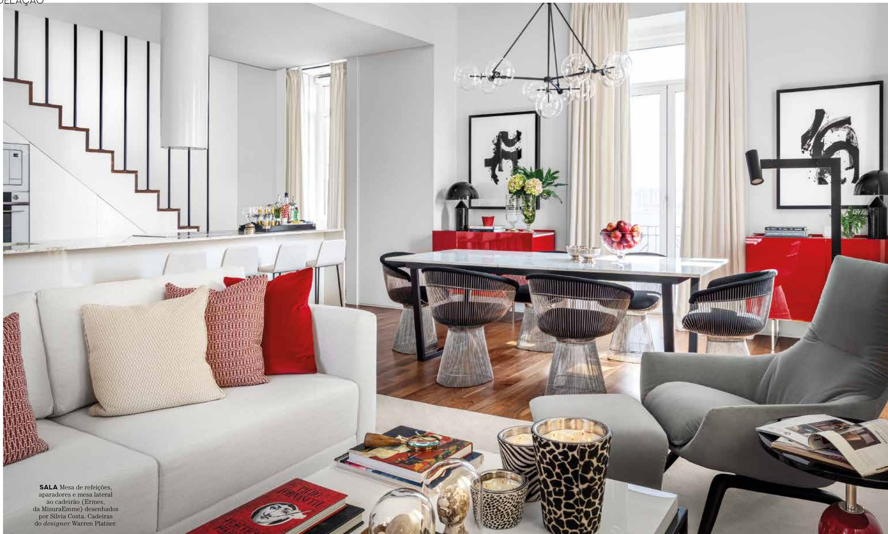
SALA Mesa de refeições, aparadores e mesa lateral ao cadeirão (Ermes, da MisuraEmme) desenhados por Sílvia Costa. Cadeiras do designer Warren Platner.