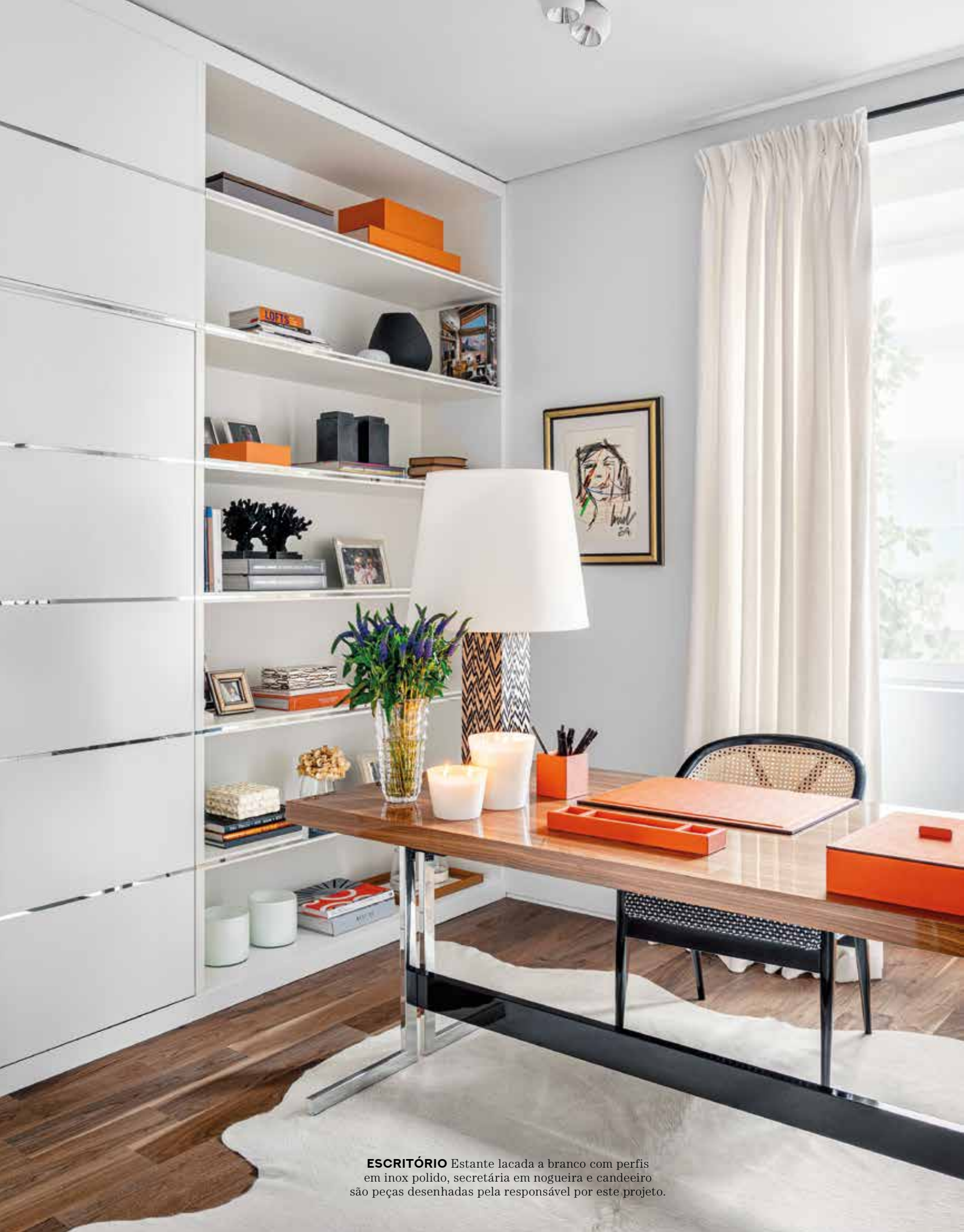
ESCRITÓRIO Estante lacada a branco com perfis em inox polido, secretária em nogueira e candeeiro são peças desenhadas pela responsável por este projeto.