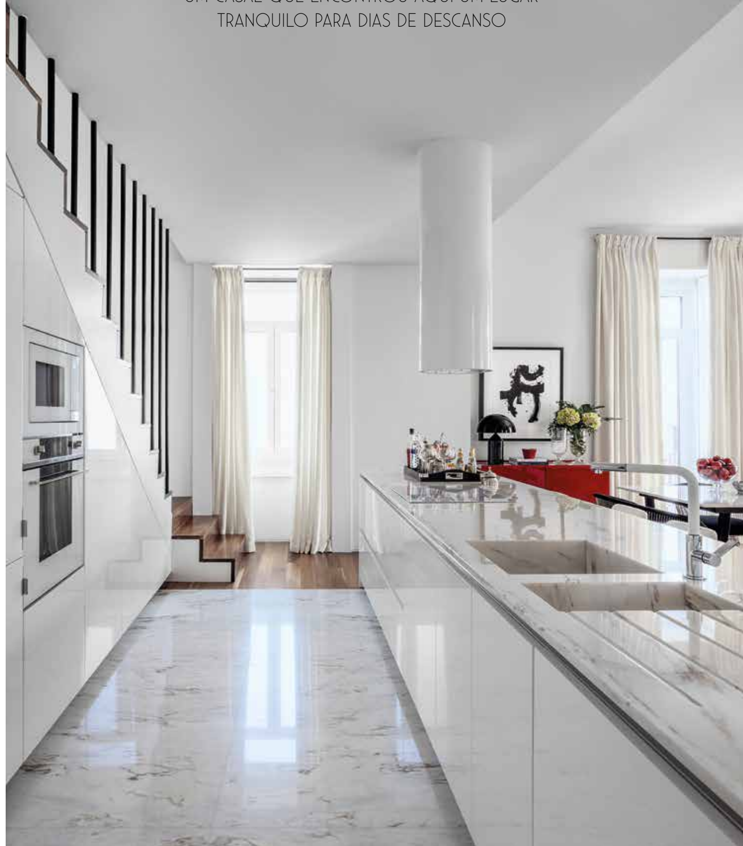
SALA COMUM Vista da cozinha integrada com a sala. Pavimento e bancada em mármore Calacatta. A base branca presente nos armários e pavimento desta cozinha potencia a luminosidade no espaço.